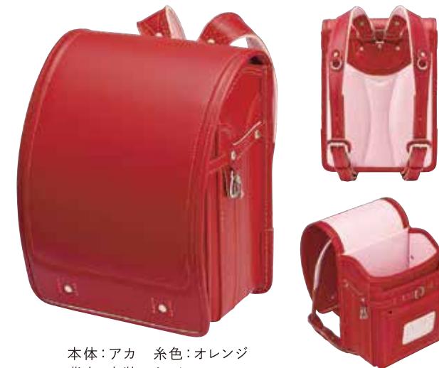
本体:アカ 糸色:オレンジ 背中・内装:ピンク