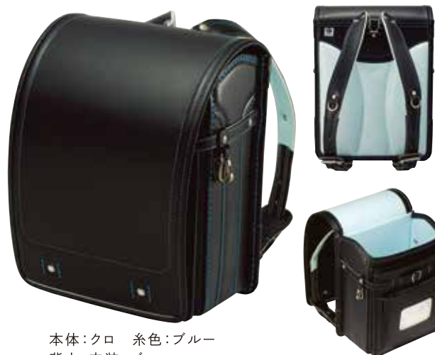
本体:クロ 糸色:ブルー 背中・内装:ブルー